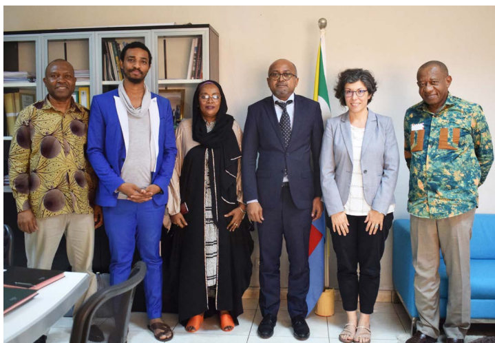
Rencontre entre SEM Ahmed Bazi Selim Ministre de l'Economie, de l'Industrie, des Investissements, chargé de l'Intégration Economique, l'ONUDI et le CIR.

Ce rôle a été utile dans la pré-identification des secteurs prioritaires avec le soutien de l'ONUDI.