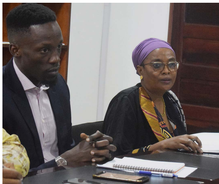
Réunion technique du programme APILE au Bureau de l'Union européenne en Union des Comores.